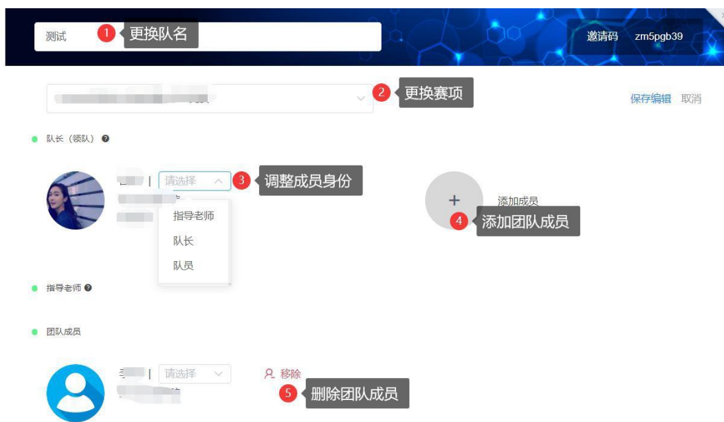
图 13 团队编辑操作页面