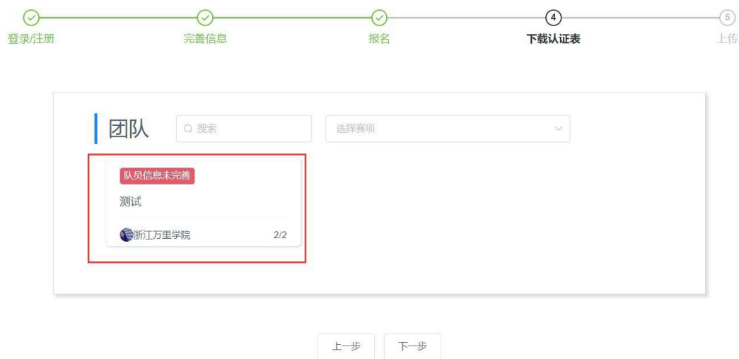
图 11 团队成员管理入口